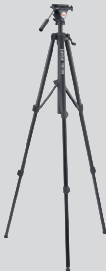
Leica TRI 100 Stativ Art. Nr. 757 938