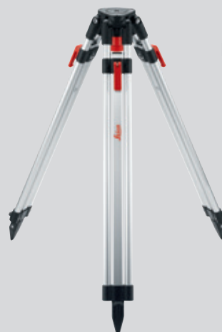
Leica TRI 200 Stativ mit 1/4" Gewinde Art. Nr. 828 426