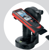
Leica FTA360-S Adapter Art. Nr. 828 414