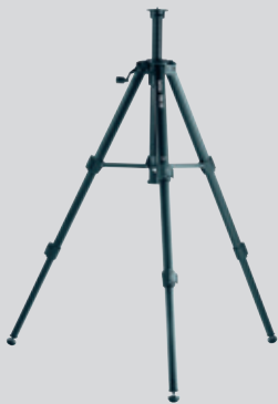
Leica TRI 70 Stativ Art. Nr. 794 963