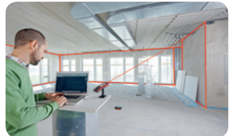
Echtzeitübertragung von Punkt-Koordinaten