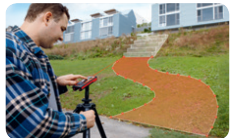
Messen von Punkten und Flächen